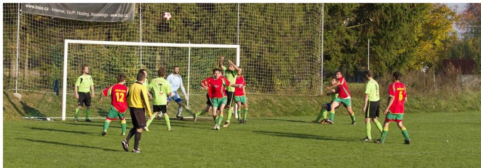
Snaha ohrozit soupeřovu branku našim hráčům v prvním poločase nechyběla.