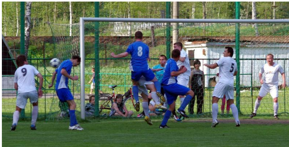
Z posledního mistrovského utkání s Hrabišínem na jaře 2012.